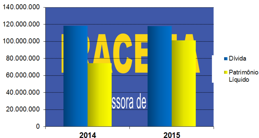
Gráfico: Dívida X PL (Valores em R$ mil)

Recomendamos a leitura completa das Demonstrações Contábeis, Relatório de Administração e Parecer dos Auditores Independentes para melhor análise da situação econômica e financeira da Companhia.